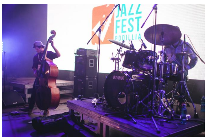
Фестиваль джазу «Jazz Fest Podillya»