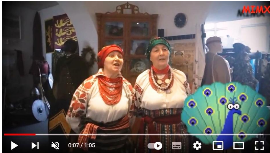
Відеоцикл «Пісенна спадщина Поділля» музею історії міста Хмельницького

Проведено 136 екскурсій, змонтовано 59 виїзних та стаціонарних виставок, надійшло у фонди більше як 700 предметів. Музеї відвідало 17300 осіб.