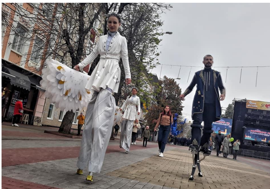
День міста Хмельницького «Хмельницькому – 590: Магія любові і добра»

фестиваль «TRANSLATORIUM, 2021», Міжнародний фестиваль моновиств «Відлуння», фестиваль-конкурс з соціальних танців «Нестримний потік», фестиваль аматорського театру «АКТ Другий. Урбаністичний», свято Купала у Молодіжному парку, День Героїв, новорічно-різдвяні свята на Різвяному ярмарку.