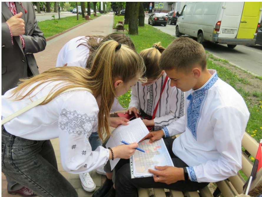
Історична квест-гра для шкільного юнацтва «Слідами Героїв»

З поміж змістовних заходів: круглі столи та конференції, показ пересувної виставки «Наука – це вона», як частини освітнього арт-проекту ініційованого STEM is FEM за підтримки міжнародних організацій ООН Жінки в Україні та Дитячого фонду ООН (ЮНІСЕФ) в Україні як частина глобальної кампанії UN Women «Покоління рівності», виставка фоторобіт обласної організації Національної спілки фотохудожників України, історична квест-гра для шкільного юнацтва «Слідами Героїв», присвячена українській історії та героїці до Дня Героїв разом з Молодіжним Центром, фотодокументальні виставки: «Пробудження нації», «Українське військо - 1917-1921 рр.».