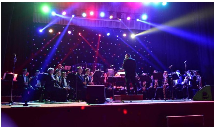
Хмельницький академічний муніципальний естрадно-духовий оркестр

Надано статус «академічного» Хмельницькому муніципальному естрадно-духовому оркестру.