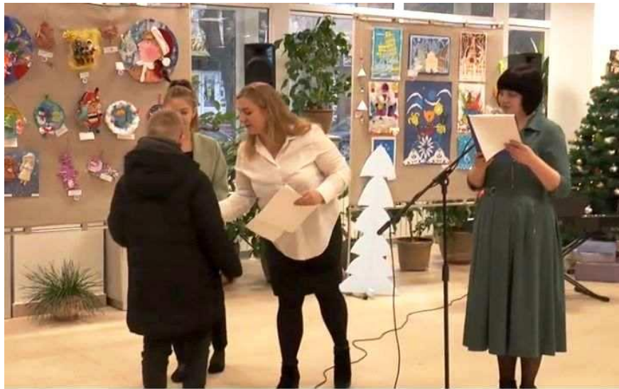
Конкурс української народної іграшки та новорічної атрибутики «Різдвяна фесрія»

14 учнів та 20 працівників культури та діячів мистецтва стали стипендіатами міської ради.