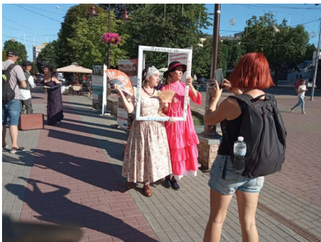
Стріт-арт проєкт «Вони любили наше місто, а ти?»