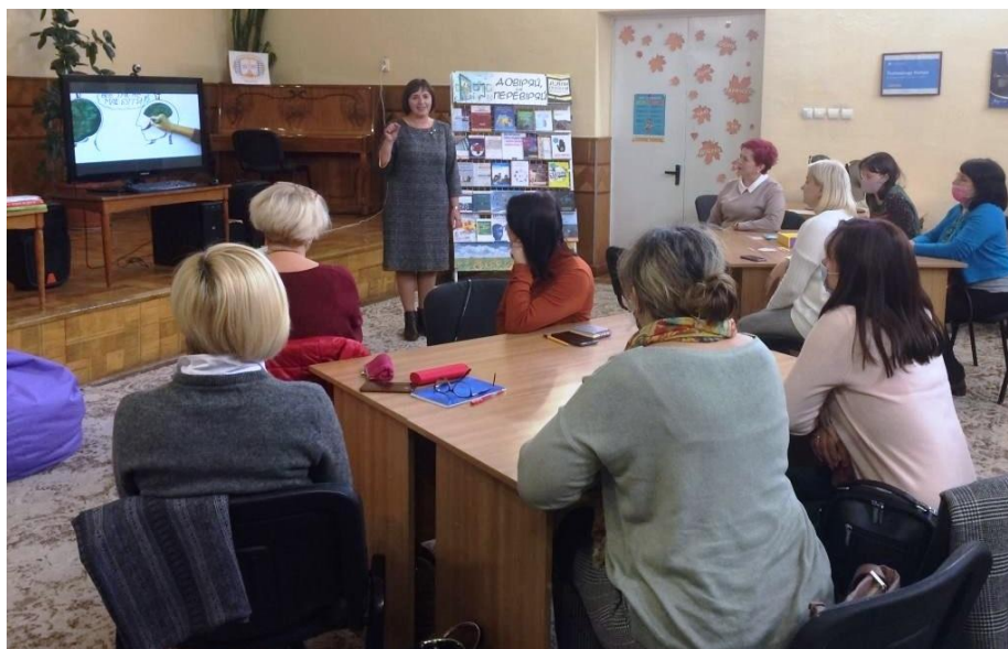
Фестиваль інфомедійної грамотності