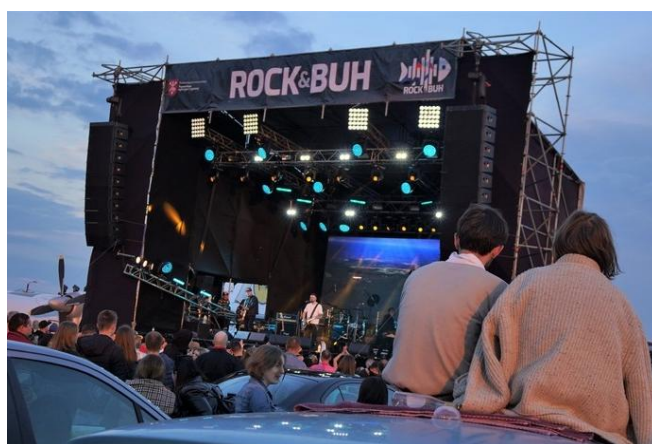
Фестиваль рок-музики «Rock&Buh»