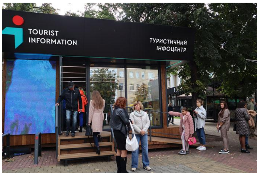
Комунальне підприємство «Хмельницький туристично-інформаційний центр»

Вагомі зміни відбулися у мережі закладів культури. Затверджено новий Перелік закладів культури базової мережі Хмельницької міської територіальної громади. Створено комунальне підприємство «Хмельницький туристично-інформаційний центр», затверджено його Статут і Програму розвитку інформаційної інфраструктури туристичних послуг на 2021-2023 роки. Встановлено 10 туристичних кіосків, які інформують громадян щодо об'єктів туризму та туристичної інфраструктури, культурно-мистецьких заходів.