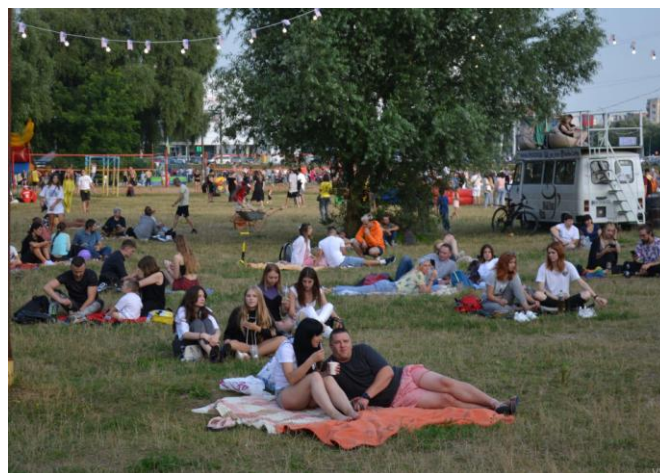
Американський пікнік у Молодіжному парку