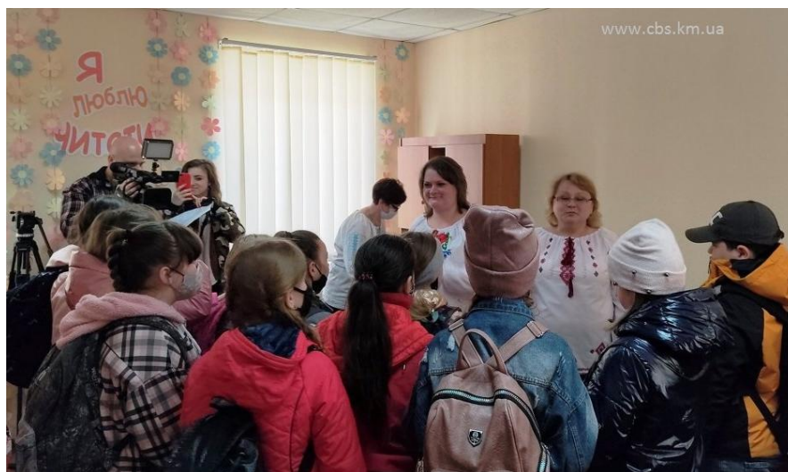
Мобільний бібліотечний пункт у мікрорайоні Ружична

Відкрито філію музичної школи №1 імені Миколи Мозгового у с. Давидківці, розраховану на 50 учнів. Створено 5 центрів культури і дозвілля, затверджено їх Статути та штатні розписи та 12 бібліотек – філій, 2 бібліотечних пункти централізованої бібліотечної системи у старостинських округах Хмельницької міської територіальної громади та мобільний бібліотечний пункт для обслуговування мешканців мікрорайону Ружична від бібліотеки-філії №7.