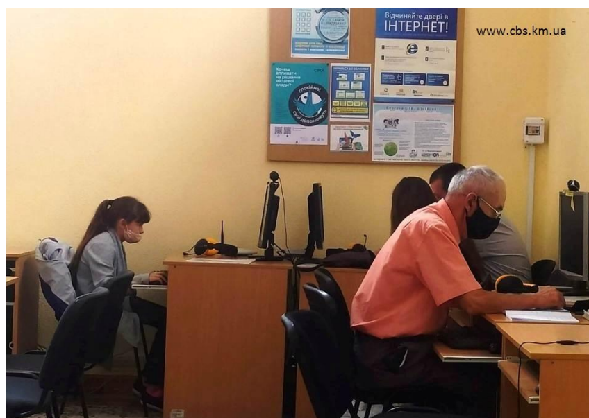
Центральна публічна бібліотека Хмельницької міської ТГ – найкращий хаб цифрової освіти

Відкрито «Мобільний консультативний центр з цифрової освіти для людей з особливими потребами» у бібліотеці-філії №11, а також офіційні хаби цифрової освіти у 4 сільських бібліотеках-філіях (с. Давидківці, Пирогівці, Водички, Масівці) від національної онлайн-платформи «Дія. Цифрова освіта». Центральна публічна бібліотека Хмельницької міської територіальної громади стала найкращим хабом цифрової освіти в Україні, здобувши перемогу у Першому Всеукраїнському конкурсі «Української бібліотечної асоціація» та Міністерства цифрової трансформації України; отримала перемогу в обласному конкурсі серед публічних бібліотек «Бібліотека – громаді» як краща міська бібліотека.